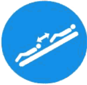
Рисунок И.10 — Соблюдай дистанцию