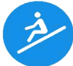
Рисунок И.3 — Положение сидя лицом вперед