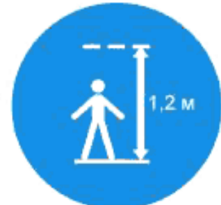
Рисунок И.12 — Максимальный рост для конкретной горки