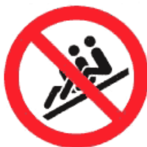
Рисунок К.2 — Спуск цепочкой запрещен