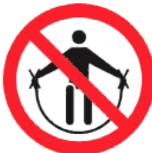
Рисунок К.5 — Запрещено держаться за борта трассы спуска