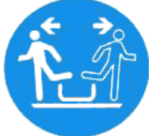
Рисунок И.6 — Немедленно покинуть специальное приемное устройство