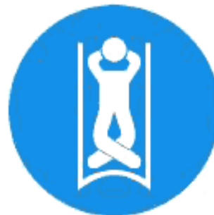
Рисунок И.14 — Положение на спине, головой назад, ноги скрещены, руки за головой