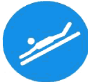
Рисунок И.2 — Положение на животе головой вперед