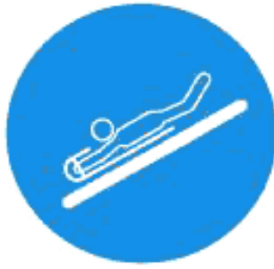
Рисунок И.9 — Пользоваться ковриком