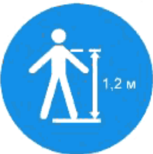
Рисунок И.13 — Минимальный рост для конкретной горки