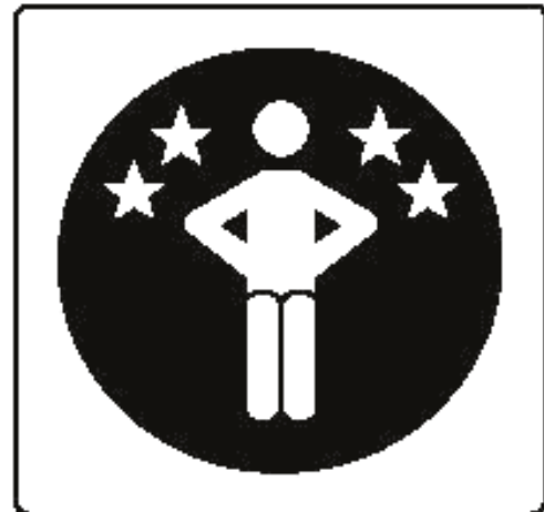
Рисунок Л.2 — Спуск в темноте