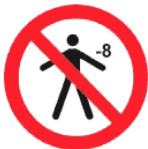
Рисунок К.4 — Детям младше 8 лет спуск запрещен