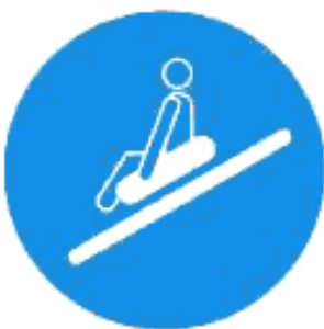
Рисунок И.7 — Пользоваться одноместным рафтом