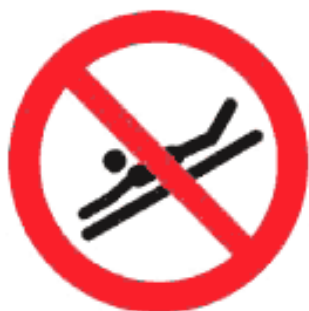
Рисунок К.1 — Положение на животе головой вперед запрещено