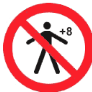
Рисунок К.3 — Детям старше 8 лет спуск запрещен