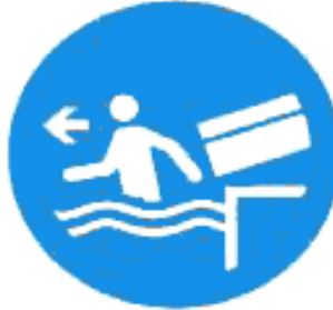
Рисунок И.5 — Немедленно покинуть зону финиша