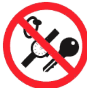
Рисунок К.6 — Запрещен спуск с посторонними предметами