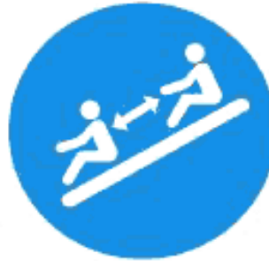
Рисунок И.11 — Соблюдай дистанцию