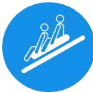
Рисунок И.8 — Пользоваться многоместным рафтом