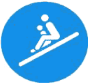
Рисунок И.4 — Положение сидя, ребенок перед взрослым, лицом вперед