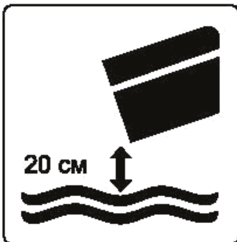
Рисунок Л.3 — Высота падения в воду при завершении спуска